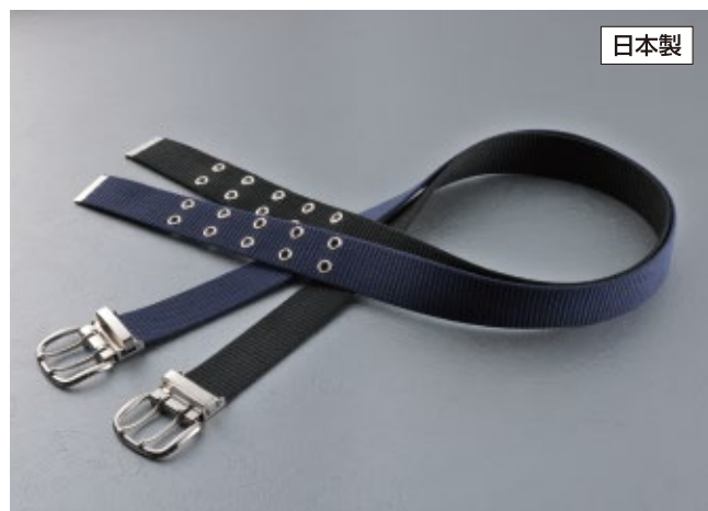
綿製2ピンバックルベルト No.WP-40 40mm幅 40mm幅×1,130mm ¥1,100 ベルト色：紺 201113 黒 201106 製品重量：約124g