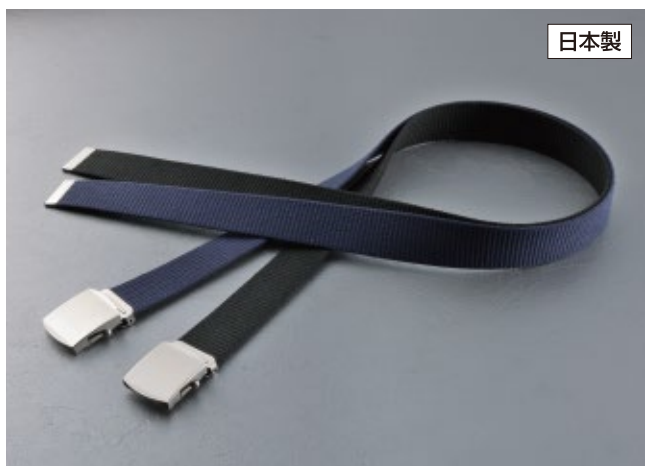
綿製ローラーベルト No.R-40 40mm幅 40mm幅×1,130mm ¥900 ベルト色：紺 201144 黒 201137 製品重量：約102g