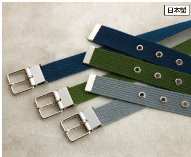
No.34 34mm幅×1,080mm ¥880 製品重量：約84g ベルト色：緑 200154 紺 200130 グレー 200147