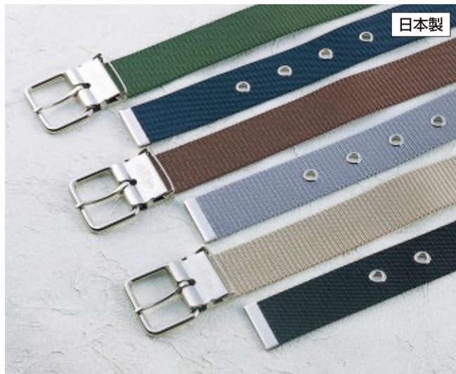
No.38 38mm幅×1,080mm ●38mm幅ナイロン製ベルト ¥1,000 ベルト色：緑 003809 紺 004004 茶 004202 グレー 004103 ベージュ 003908 黒 200673 製品重量：約133g 梱包単位：12本